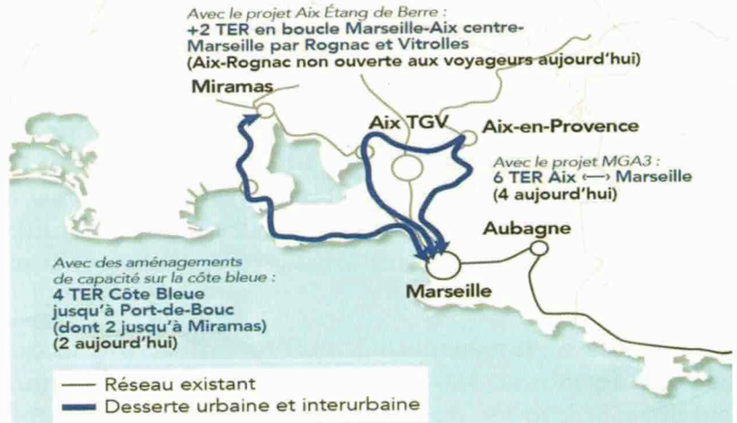
Extrait de l'avis de l'Autorité environnementale sur le projet de Ligne nouvelle Provence Côte d'Azur

La ligne C est celle de la Côte Bleue, où de nouvelles haltes et un train léger pourraient être mise en service bien avant 2035.